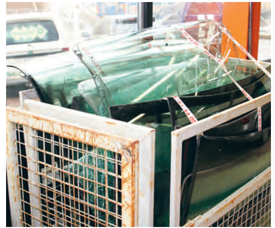
Återvinning av bilrutor.