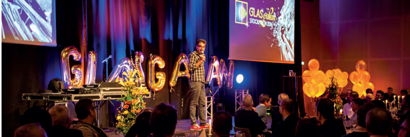
Glasdagen i Stockholm 2016.