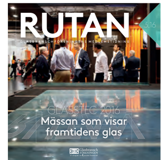
Tidningen GLAS och Rutan.